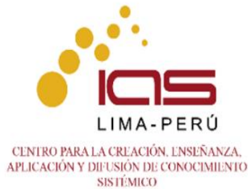
CENTRO PARA LA CREACIÓN, ENSEÑANZA, APLICACIÓN Y DIFUSIÓN DE CONOCIMIENTO SISTÉMICO