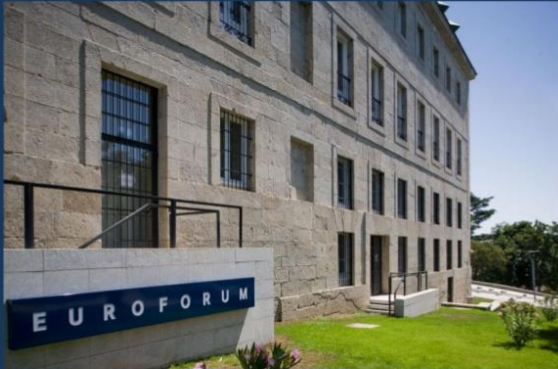
PALACIO DE LOS INFANTES