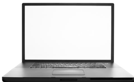
Figura 1. Nombre de la Figura.