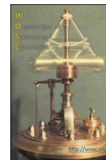
World Organisation of Systems and Cybernetics